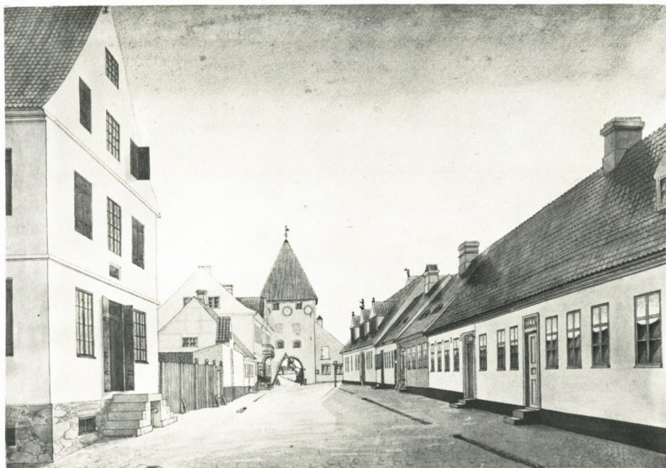
Mølleporten i Stege. Akvarel af W. Nielsen 1842. For enden af Storegade ses til venstre Frellsens gård, og overfor anes brændevinsbrænderiet. I midten, klinet op ad Mølleporten, acciseboden, der blev nedrevet i 1894 (Møns Museum).

er. Men herudover begyndte han nu også at operere uden for Stege, idet han fra et ham tilhørende fartøj foretog indsmugling af brændevin bl.a. ved Kalvehave Færggård og ved Ulvshale.