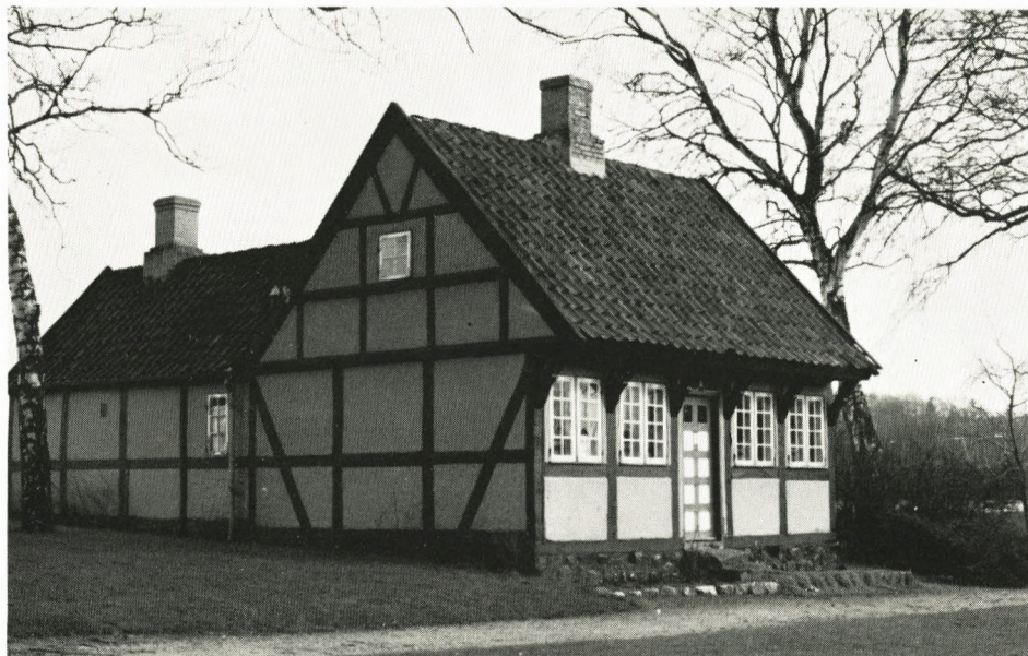
Acciseboden fra Smedegade i Slagelse flyttedes i slutningen af 1920'erne til sin nuværende plads i byens anlæg.