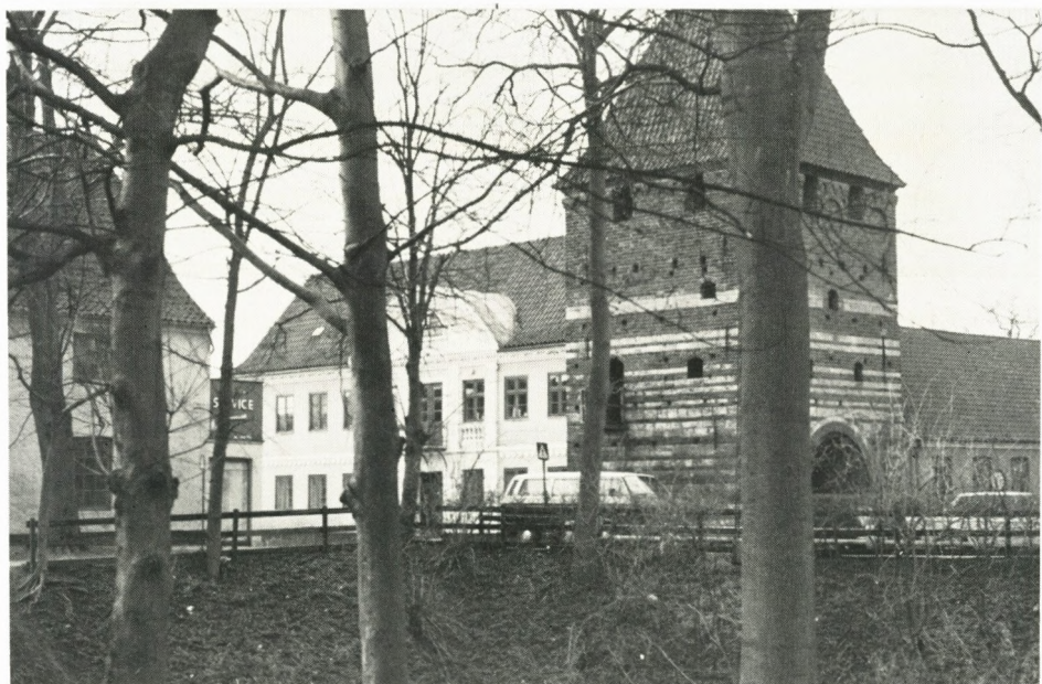
Frellsens gård set gennem den nu nedrevne accisebod. T.v. brændevinsbrænderiet, hvis have strakte sig ned til noret. Det var ad denne vej, nogle af Frellsens smuglerier foregik.

Hvis oplysningerne om, at han efter 4 års fængsling var aldeles ruineret, var sandfærdige, kan man nok henfalde i spekulationer over, hvor provenuet ved salg af 22.608 spil indsmuglede kort er blevet af.