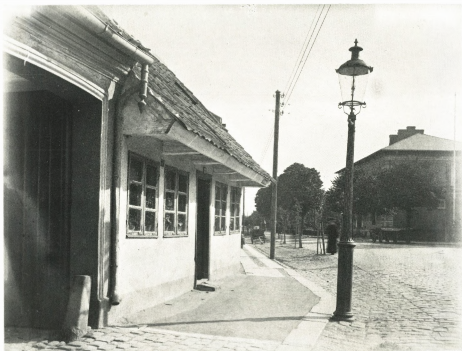
Acciseboden fra Smedegade i Slagelse flyttedes i slutningen af 1920'erne til sin nuværende plads i byens anlæg.