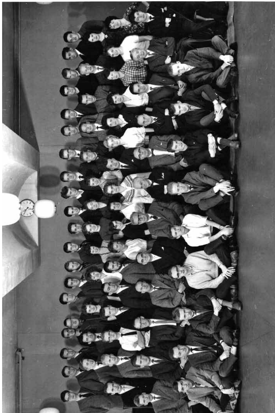
Toldelevkursusholdet 1961. Midt i billedet, i 3. række fra neden, nummer 9 fra venstre, ses forfatteren. Foto i privateje.