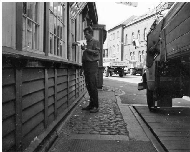
Brovægt i Frihavnen. Varemodtagerens repræsentant modtager efter vejningen og opsynets undersøgelse den attesterede klareringsattest.

Et af stederne, vi kom, var »Prøvekontrollen« på toldboden. Det var stedet, hvortil man sendte ting, der var specielle, og som man ikke rigtigt vidste, hvordan skulle fortoldest. Tvivlstilfælde. Fortoldningssteder sendte deres spørgsmål med prøver her