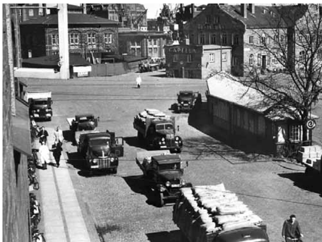
Brovægt 10, Frihavnen, fotograferet fra Langelinie. Foto ca. 1955 i Told-Skat Museet.