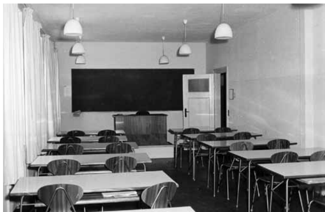
Toldelevskolens klasselokale i Guidekasernen.