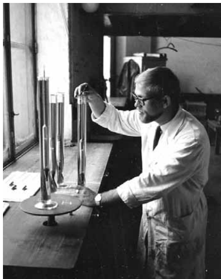
Gradering af spiritus i spiritusvejerboden på Københavns Toldkammer. Foto fra 1960'erne i Told-Skat Museet.

nem spunshullet for at få en prøve op. Det blev så hældt over i høje laboratorieglasser, og man kunne så ved hjælp af et alkoholometer måle mængden af alkohol.